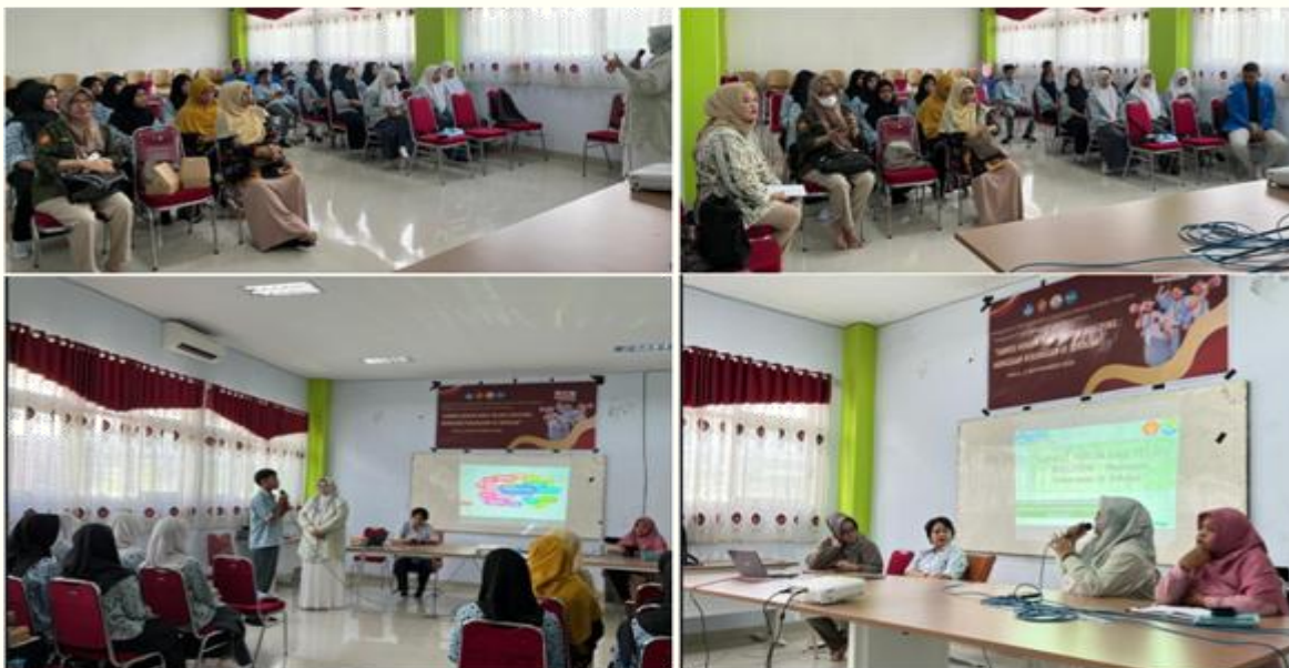
Gambar. 1 Penyuluhan Hukum pada peserta didik di Madrasah Aliyah Negeri 1 Kota Palu

Konsekuensi hukum yang timbul berdasarkan Undang-Undang Nomor 11 Tahun 2012, peserta didik yang telah berumur 18 tahun dan melakukan tindak pidana bullying dianggap tidak dapat menempuh mekanisme pada sistem peradilan anak. Peserta didik yang telah berumur 18 tahun, secara hukum, tidak lagi dianggap sebagai anak tetapi telah dikategorikan sebagai orang dewasa 12 , sehingga mekanisme yang ditempuh adalah melalui peradilan umum. Ini berarti sanksi pidana akan dikenakan sepenuhnya terhadapnya dan dapat dimintai pertanggung jawaban pidana. Oleh karena itu sasaran penyuluhan hukum pada kegiatan pengabdian ini adalah peserta didik pada satuan satuan pendidikan jenjang menengah, yakni Madrasah Aliyah Negeri 1 Kota Palu. Siswa-siswa diharapkan mengenal dan memahami bentuk-bentuk kekerasan bullying di sekolah sebagai tindak pidana dan memperoleh pengetahuan hukum mengenai akibat hukum yang timbul atas tindakan bullying berupa sanksi pidana, sehingga mampu mencegah mereka untuk melakukan tindak pidana bullying di sekolah.