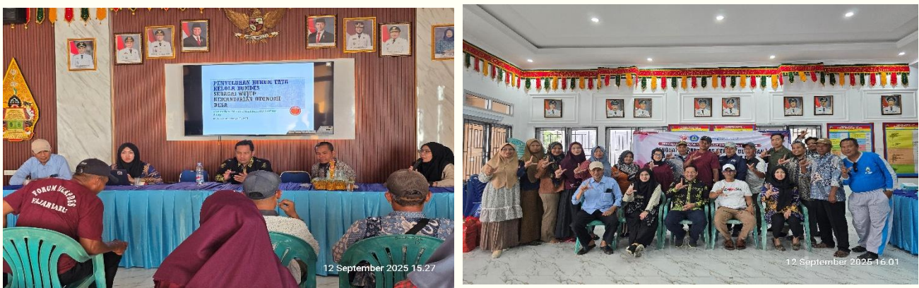
Gambar 1. Penyuluhan tentang Tata Kelola BUMDes Desa Fajar Baru

Selain itu, motivasi pengelola BUMDes juga sering melemah akibat pembatasan masa jabatan direktur atau pelaksana operasional, sebagaimana diatur dalam PP No. 11/2021 tentang BUMDes yang hanya memperbolehkan masa kerja dua periode. Bagi banyak pengelola, pembatasan masa kerja ini menimbulkan keraguan untuk berjuang total membangun pondasi bisnis BUMDes, karena meskipun mereka bersusah payah merancang dan mengembangkan unit usaha hingga berhasil, belum tentu mereka dapat menikmati hasil dari perjuangan tersebut dalam jangka panjang. Dengan demikian, hambatan psikokultural ini bukan hanya mengurangi efektivitas pengelolaan, tetapi juga menghambat proses regenerasi dan kesinambungan kepemimpinan yang diperlukan untuk memperkuat kelembagaan dan kemandirian BUMDes.